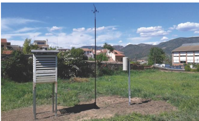
Passatge Gorgonçana, 47. Vista de la ubicació de l'estació 0163 des del juny del 2017, a la cota 176 m.