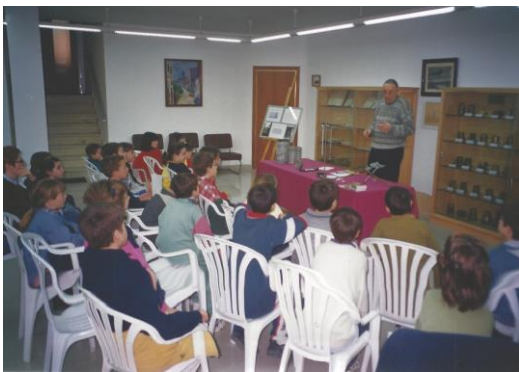
Sala de reunions d'Aigües Vidal: nens i nenes de 3r d'EGB de l'escola Puig.